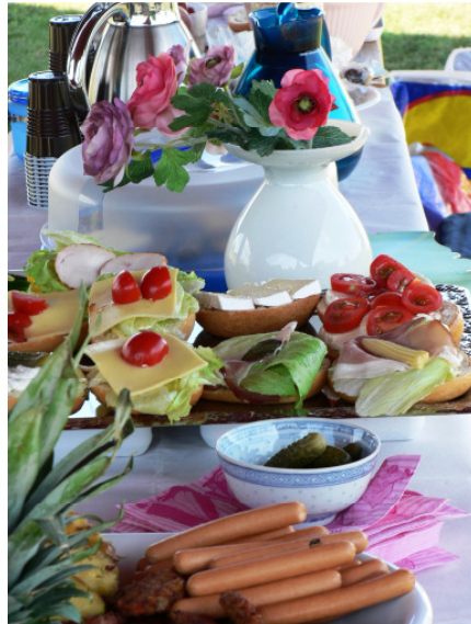
Das LLHC-Team legt großen Wert auf ausgezeichnete Halfway-Verpflegung: Würstchen, Frikadellen, diverse Sorten belegte Brötchen, Gebäck, frisches Obst, Gemüse-Sticks, Leckereien sowie frisch aufgebühret Kaffee und eine große Auswahl an Getränken

Wie immer wartete an der Halfway-Station ein liebevoll hergerichtete Buffet auf die hungrigen Golfer/Innen.