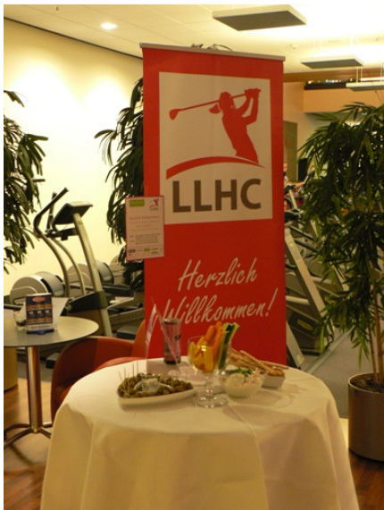
Get-Together im Elixia Wandsbek bei der LLHC Wellness & Fitness Players Night

Am Freitag vor dem Turnier hatte der LLHC eine Wellness & Fitness Players Night in den Räumlichkeiten von Elixia Wandsbek ausgerichtet. Alle zum Turnier angemeldeten Personen durften mit einer Begleitperson den ganzen Tag das Angebot des Fitness- und Wellnessstempels nutzen und Körper und Seele durch Schwimmen, Sauna und den speziellen LLHC Beweglichkeits-Fitnesskurs auf den Turniertag vorbereiten. Bei Getränken und Häppchen lernten sich die Flightpartner schon vorher kennen.