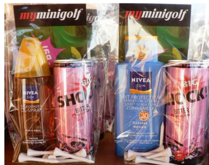
Die dank der großzügigen Sponsoren gut gefüllten LLHC-Tee-off-Tüten wurden von den Turnierteilnehmern gerne mitgenommen.