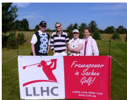
Ein typischer LLHC-Flight: drei Ladies und ein Womanizer