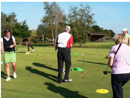
Macht einfach Spaß: der Parcours von MyMinigolf

Zur Unterhaltung der ankommenden Flights und zur Überbrückung der Wartezeit auf die Auswertung der Scorekarten hatte der LLHC auf dem Übungsgrün direkt vor dem Clubhaus einen 9-Loch Mini-golf-Parcours von „MyMinigolf“ errichtet, den jeder Teilnehmer mit möglichst wenigen Schlägen passieren musste.